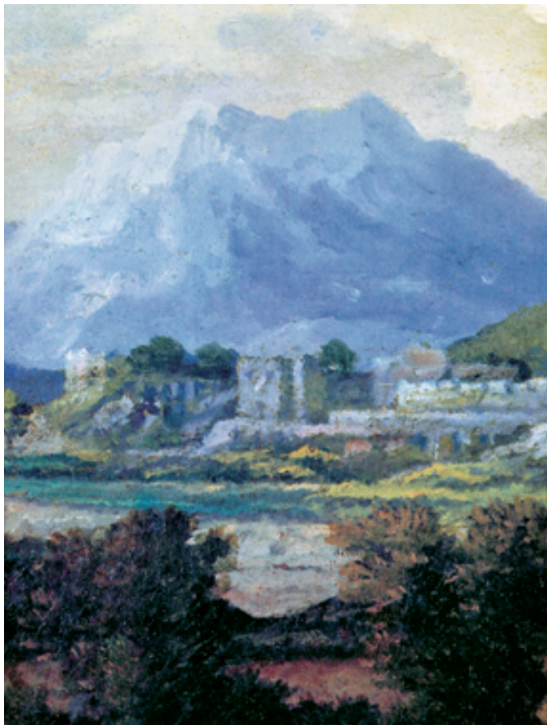
6 Nicolas Poussin, Detail aus: Der Sommer, zirka 1660/64. Paris, Louvre: Bei der Ausführung von Gemälden musste Poussin zunehmend auf das ihm noch verbleibende handwerkliche Geschick Rücksicht nehmen und auf dieser Grundlage einen ihm adäquat erscheinenden, neuen Stil entwickeln. So vergrößerte er den Maßstab der in seinen Bildern 5

Poussin hatte eine andere Vorstellung von den Segnungen und Flüssen des Alters; in einem Brief an einen befreundeten Kunden reflek-