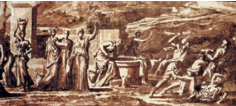
7 Nicolas Poussin, Entwurf für »Moses und die Töchter Jethros«, zirka 1647/48. Paris, Louvre.