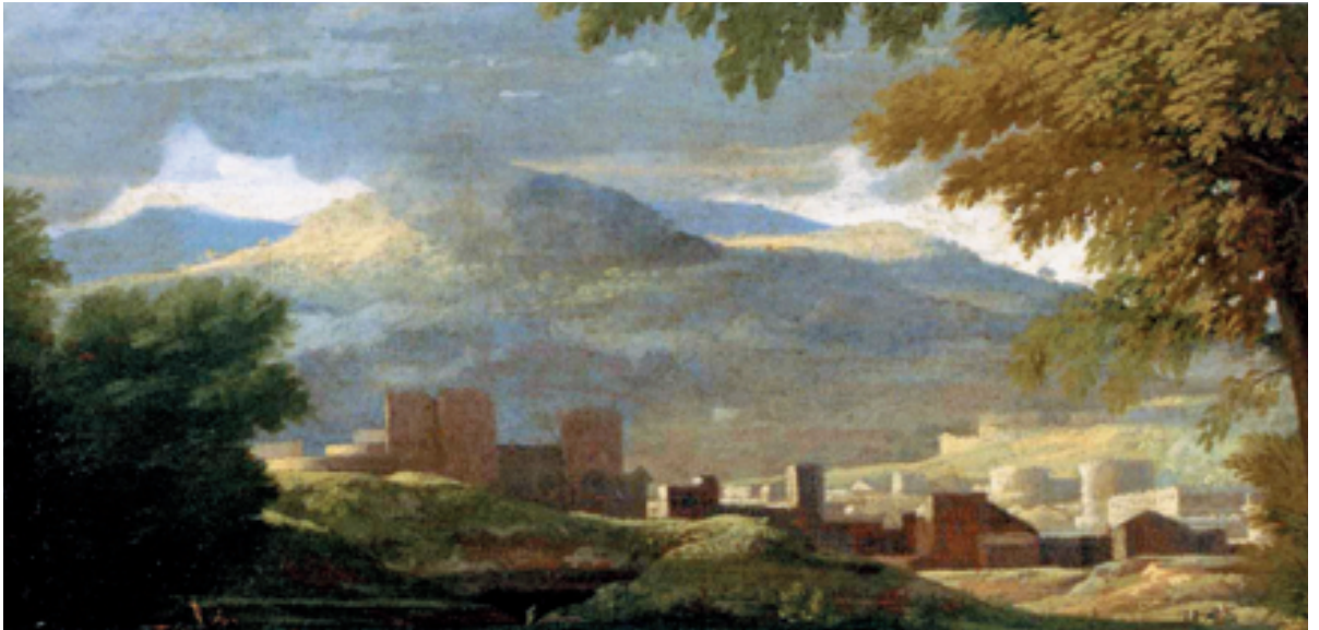
5 Nicolas Poussin, Detail aus: Landschaft mit von einer Schlange getötetem Mann, 1648, London, National Gallery.

drei Zeilen pro Tag schreiben könne 3 4 . Es sind diese – schließlich sogar ein Zittern aller Glieder umfassenden – Symptome, die dafür sprechen, dass Poussin an der Parkinson'schen Krankheit gelitten hat.