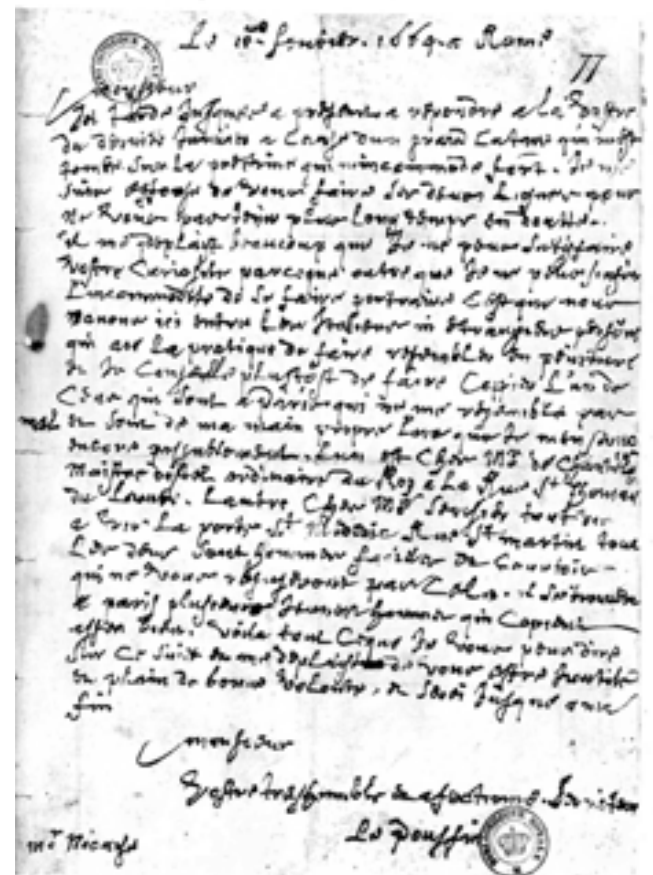
4 Nicolas Poussin, Brief an den Abbé Nicaise vom 18. Februar 1664, Paris, Bibliothèque Nationale: Die beiden aus unterschiedlichen Lebensphasen vor und nach Ausbruch der Krankheit stammenden Briefe 3 4 dokumentieren anschaulich das ab 1648 in Poussins Korrespondenz erwähnte und von späteren Biografen bezeugte heftige »Zittern der Hand«: Der Strich der Buchstaben wird zunehmend unsicher, das Schriftbild zerfällt, und man kann sehen, welche Mühen es den Maler zuletzt gekostet hat, die Zeilen zu verfassen.

Tatsächlich hatte Poussin zuvor bereits in seinen Briefen immer wieder über Gesundheitsbeschwerden geklagt, die ihn zuweilen wochenlang an sein Bett fesselten. Doch zwei Jahre nach Abbruch der Ar-