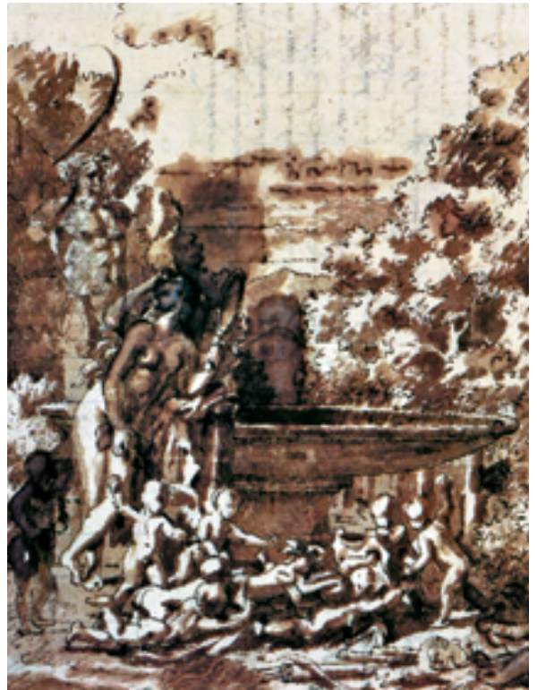
8 Nicolas Poussin, Zeichnung mit »Venus am Brunnen«, zirka 1659. Paris, Louvre: Auch anhand der Zeichnungen Poussins lassen sich die Symptome der Krankheit beobachten: Vermag der Künstler in der unmittelbar vor Ausbruch der Krankheit angefertigten Zeichnung 7 Figuren und Landschaft sehr sicher mit Hilfe von Pinsel und Tinte zu gestalten (man beachte die geschickt mit wenigen feinen Pinselstrichen angedeuteten Faltenwürfe!), so zeugt das später entstandene Blatt 8 deutlich von den Schwierigkeiten, mit denen der Künstler ab 1648 zu kämpfen hatte: Der Umriss einzelner Figuren ist zitterig, und obgleich Poussin noch immer beeindruckende Leistungen wie die souverän modellierte Skulptur links gelingen, deuten die großen, das Blatt bedeckenden Tintenflecken darauf hin, dass der Maler sein Handwerkszeug nicht mehr vollständig kontrollieren konnte.

einer schwachen Hand) die besten und ausgezeichnetsten Momente der eigenen Tätigkeit erkennen. Und den griechischen Mythos vom Gesang des sterbenden Schwans aufgreifend, verspricht er seinem Freund: »Man sagt, der Schwan sänge am schönsten, wenn er dem Tode nahe ist. Ich werde versuchen, es ihm gleich zu tun und besser als je zuvor zu arbeiten und das kann der letzte Dienst sein, den ich Ihnen erweise.« ♦