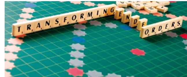
Cecilia Scheid/Cornelia Goethe Centrum 2012

Zum anderen prägen inter- bzw. transnationale Perspektiven aktuelle Debatten und wissenschaftliche Projekte der Geschlechterforschung. Im Zentrum stehen dabei unter anderem Re-Visionen hegemonialer (westlicher) Paradigmen und Erzählungen. Es geht darum, vom Rande her zu denken, bisher ausgeschlossene Sichtweisen einzubeziehen und von dort aus Fakten und Daten neu zu bewerten und andere Zusammenhänge herzustellen.